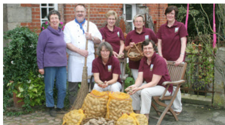
Die Aktionsgruppe Hauswirtschaft stellt ihr neues Kochbuch vor: Eine Hommage an die Kartoffel!

Am Sonntag, 25. September findet ab 11 Uhr auf dem Kulturgut Ehmken Hoff ein besonderes Fest rund um die Kartoffel statt. Neben den gewohnten Ständen des Vereins Ehmken Hoff werden auch die örtlichen Landwirte mit eigenen Ständen vertreten sein und außer Kartoffeln auch Kürbisse und andere regionale Spezialitäten anbieten. Sie werden auch gerne über die Besonderheiten rund um die Kartoffel fachkundig informieren. Die Aktionsgruppe „Hauswirtschaft“ arbeitet zur Zeit intensiv an der Herausgabe eines speziellen Kartoffelkochbuchs, das pünktlich zum Fest vorgestellt und verkauft wird. Die Gruppe wird auch gleich einige Kostproben aus ihrem Kochbuch anbieten und hat eine Besonderheit kreiert: den „Ehmken Hoff Fruchtaufstrich“, eine spannende