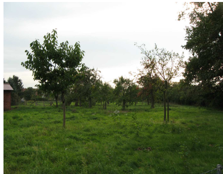
So könnte später die Streuobstwiese aussehen

Auf dem Nachbargrundstück zum Kulturgut Ehmken Hoff wird eine Streuobstwiese angelegt. Auf dem Pachtgrundstück sollen hochstämmige Obstsorten angepflanzt werden. Dieses Projekt wurde gemeinsam von der H.F. Wiebe Stiftung und dem Ehmken Hoff e.V. initiiert und von der Gemeinde unterstützt. Alle zehn Ortsvorsteher der Gemeinde spendeten aus Verbundenheit zum Kulturgut jeweils einen Gutschein für einen Obstbaum alter Sorte. Die Streuobstwiese soll am Sonntag, dem 24. Oktober um 11.15 Uhr auf dem von der Kirche gepachteten Grundstück unter kompetenter Anleitung der Baumschule Reinhardt (Westen) angelegt werden.